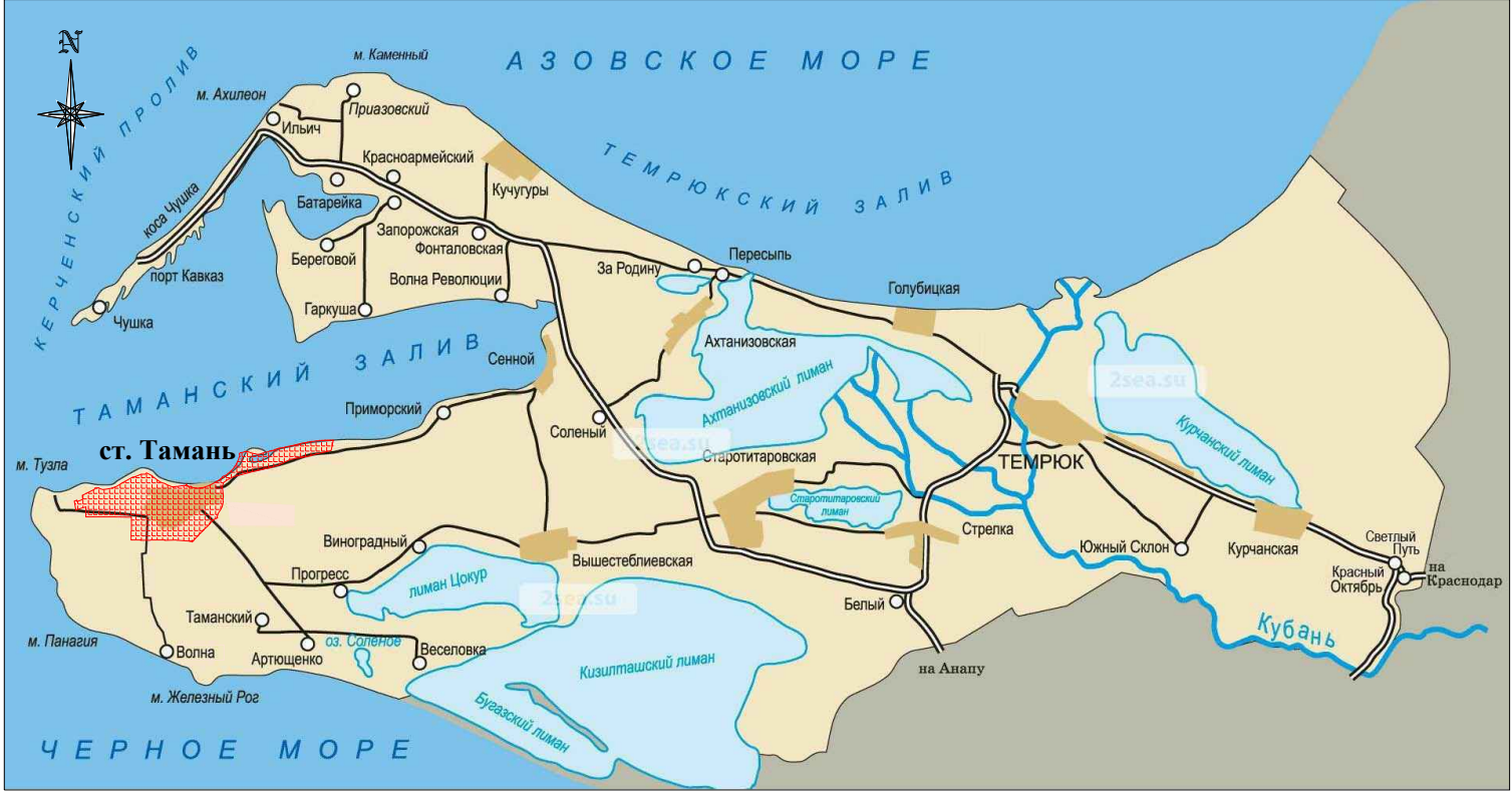
Схема размещения элемента планировочной структуры в границах Таманского сельского поселения. М 1:25 000.