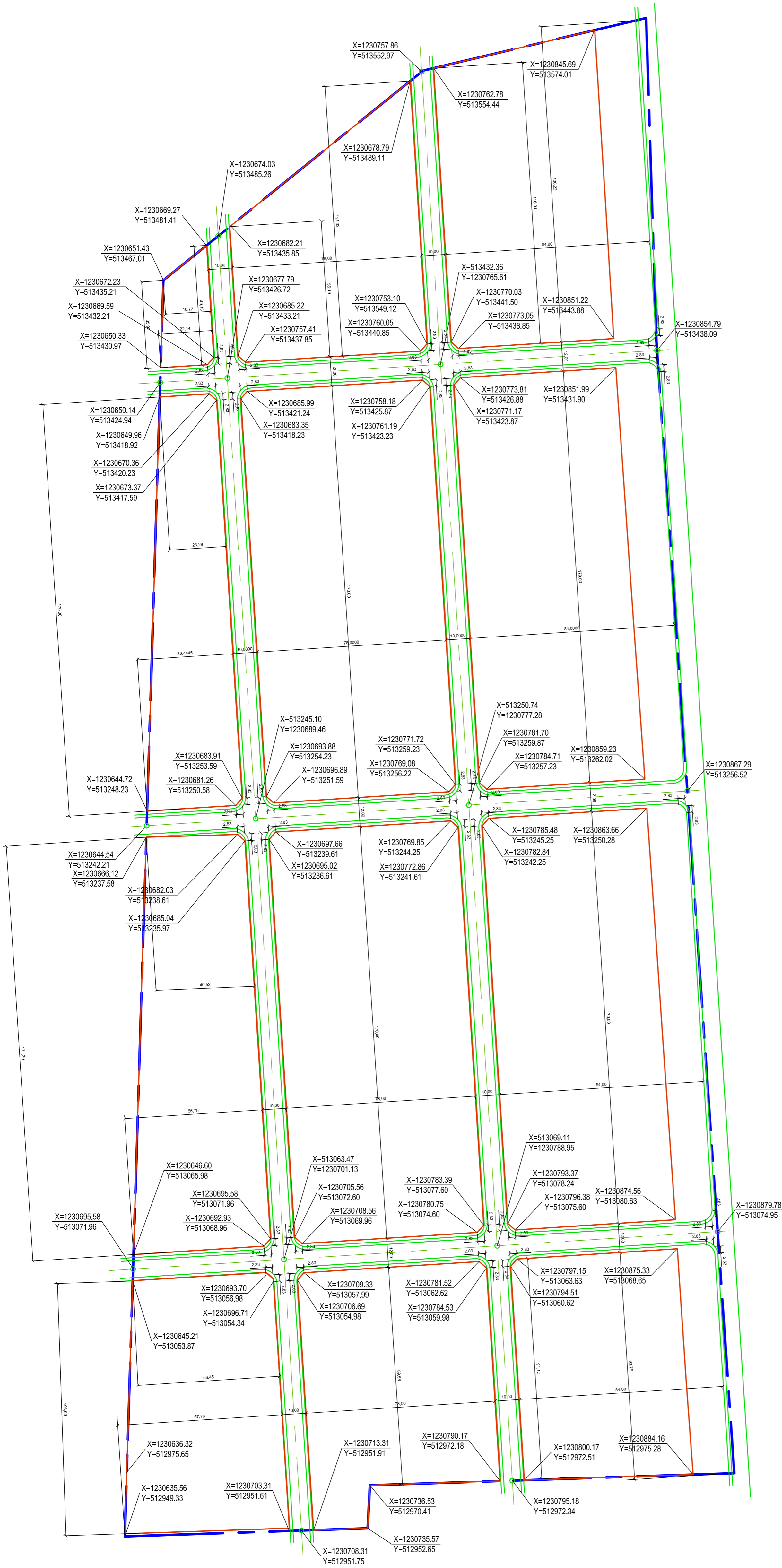
Улица №1 (Сечение 1 - 1) Проектируемая