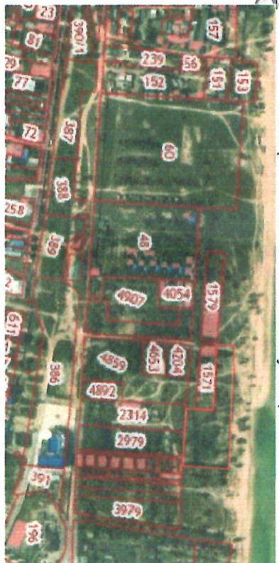
Схема расположения нестационарного пляжного оборудования к порядковому номеру объекта 64, 65 текстовой части

Ситуационный план, Темрюкский район, северо-восточнест. Голубицкой