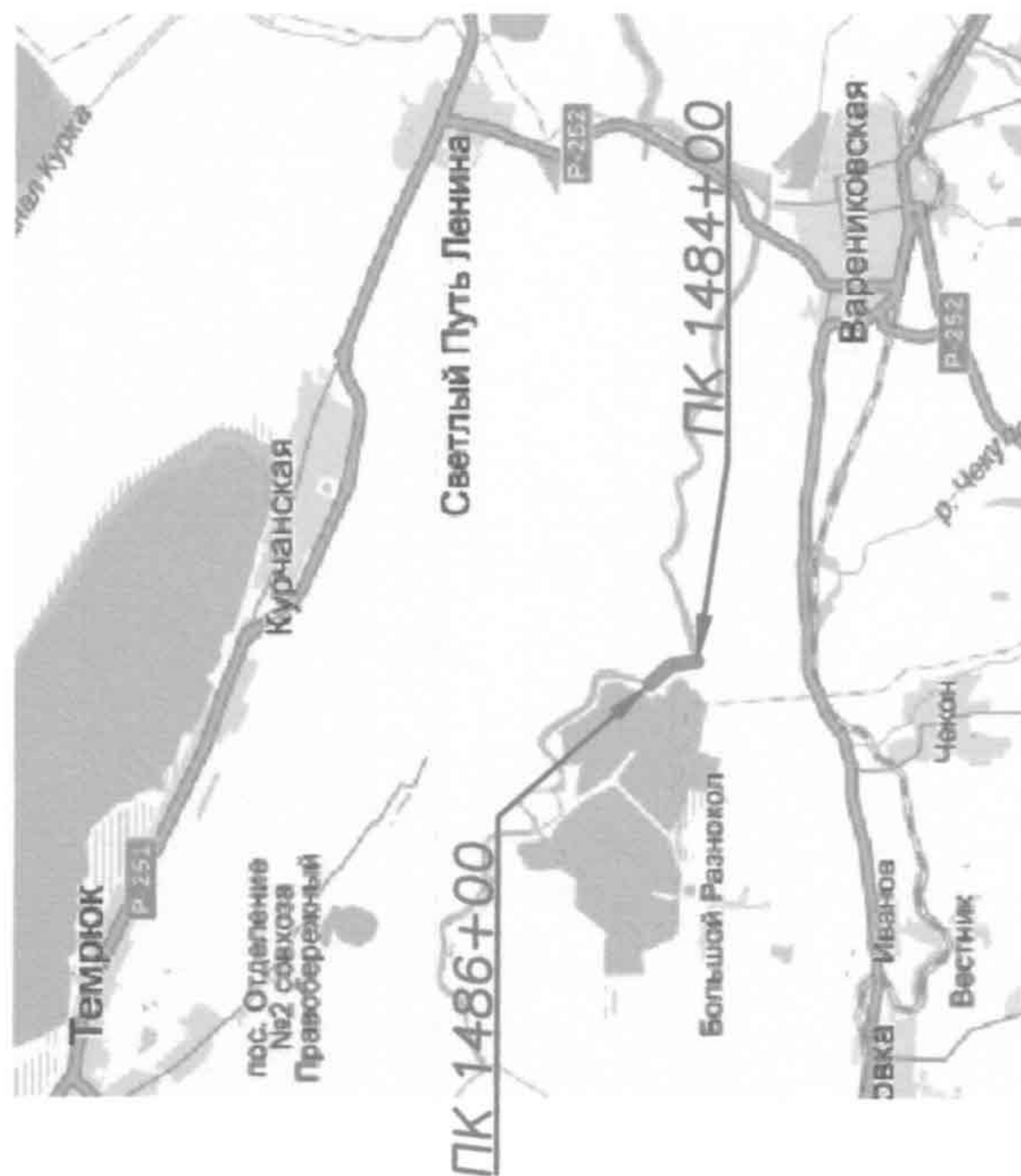
СХЕМА РАЗМЕЩЕНИЯ ЗЕМЕЛЬНОГО УЧАСТКА В СТРУКТУРЕ КУРЧАНСКОГО СЕЛЬСКОГО ПОСЕЛЕНИЯ ТЕМРЮКСКОГО РАЙОНА

к постановлению администрации муниципального образования Темрюкский район от 20.04.2017 № 696