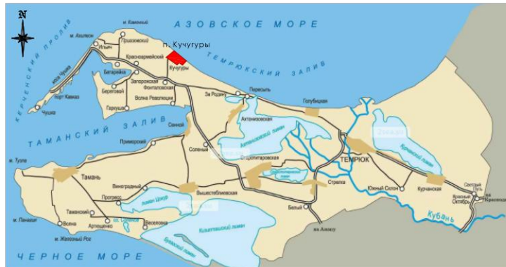
Схема размещения элемента планировочной структуры в границах Фонталовского сельского поселения. М 1:25 000.